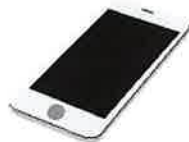
マイナンバーカード読取対応 のスマートフォン